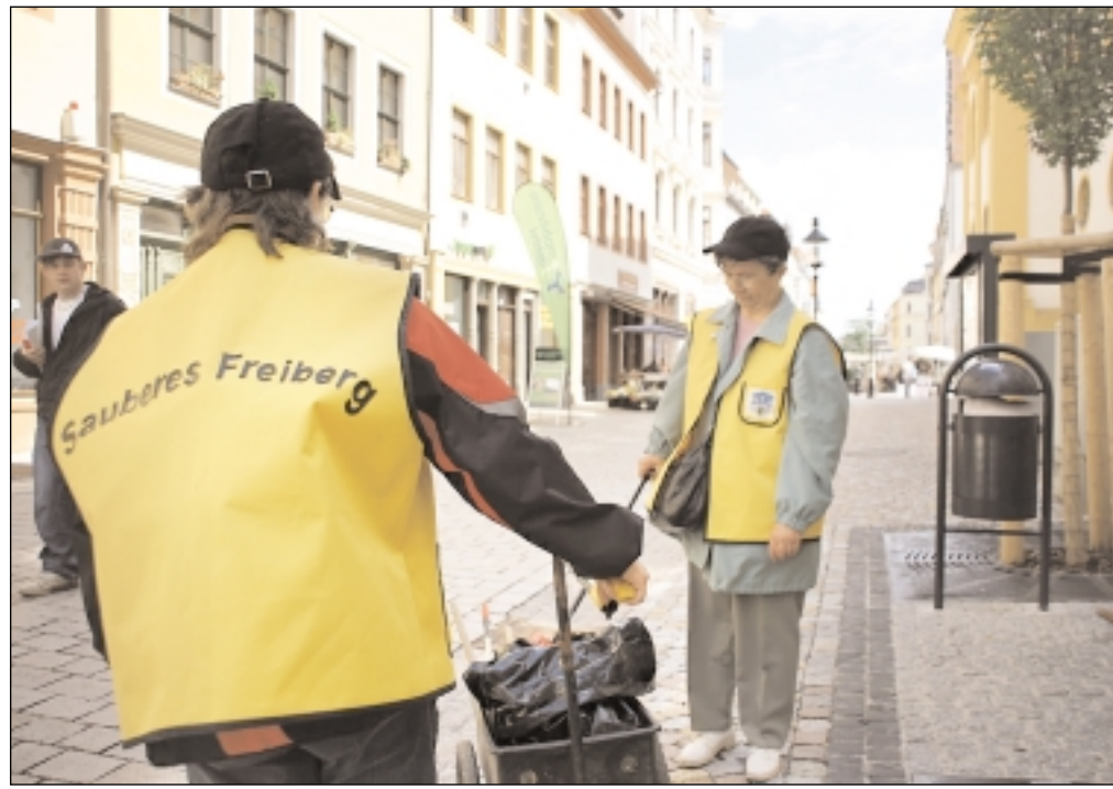
Gut an ihren gelben Westen mit dem Aufdruck „Sauberes Freiberg“ und dem Stadtwappen zu erkennen: die so genannten „Stadtläufer“ – wie diese beiden der insgesamt 25 Projekt-Mitstreiter.

körbe haben wir reichlich, sodass eigentlich nichts unachtsam geworfen werden müsste. Und für Hundehalter geben wir kostenlos Hundekotbeutel aus.“ Die Stadtläufer realisieren ihre Einsätze teilweise nach vorgegebenen Tourenplänen, teilweise durch zusätzliches Durchstreifen der Innenstadt. Immer wieder gilt es hier weggeworfene Dosen, Tüten und anderen Unrat wie auch Hundekot zu beseitigen. „Außerdem helfen sie mit, die Taubenplage einzudämmen“, erklärt Jürgen Markgraf. Immer wieder in den Einsatz werden die Stadtläufer auf den Obermarkt und den Petriplatz geschickt, aber auch ins Kirchgässchen, auf die Peters- oder die Burgstraße, die sich als Dauerbrenner zeigen. „Doch ich denke, Freiberg kann sich auch hinsichtlich Sauberkeit sehen lassen“, lobt das Stadtoberhaupt alle Beteiligten.