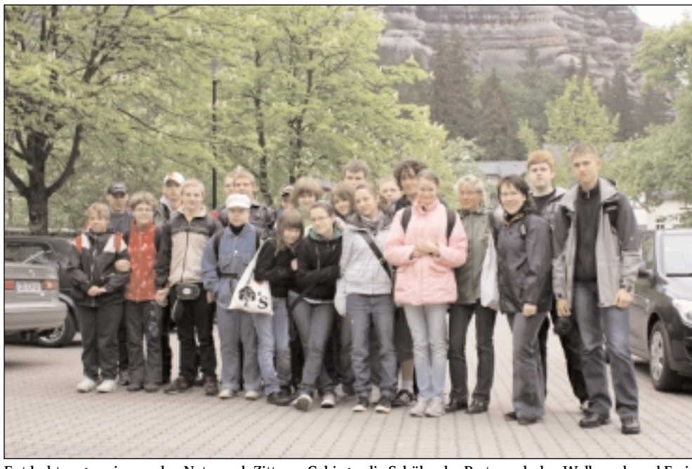
Entdeckten gemeinsam den Naturpark Zittauer Gebirge: die Schüler der Partnerschulen Walbrzych und Freiberg.

(UW). Fünf erlebnisreiche Tage haben die Schüler aus der Integrationschule in Walbrzych Mitte Mai gemeinsam mit ihren Freiburger Partnern aus der Förderschule „Albert Schweitzer“ im „Querxenland“ Seiffhennersdorf, einem der schönsten und größten Kindererholungscentren in der Oberlausitz, verbracht. Mit viel Wärme und Herzlichkeit wurden die Walbrzycher Schüler und ihre Lehrer durch die Gastgeber empfangen und betreut. Spaß, Spiel, Abenteuer und Erholung standen im Mittelpunkt eines abwechslungsreichen Programms des Schüleraustausches beider Partnerschulen. Tägliche Veranstaltungsangebote, umfangreiche Freizeitstätten im KIEZ sowie interessante Ausflugsziele in der Umgebung ließen keine Langeweile aufkommen. Nach den anstrengenden Tagen standen abends sportliche Aktivitäten im Vordergrund: Fußball, Volleyball, Tischtennis, Bowling und Fitnesstraining. Jeder konnte aus dieser reichhaltigen Palette seinen Lieblingssport auswählen. Auch Diskos und Grillabende gehörten zum Alltag. Bei letzterem konnten die polnischen Schüler den ihnen unbekannt Knüppelkuchen kosten.